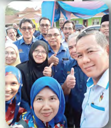
KKKP HEBAT MENUJU 2020