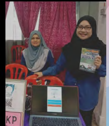
ZIPPY_INFOTECH @ KKKP 2019