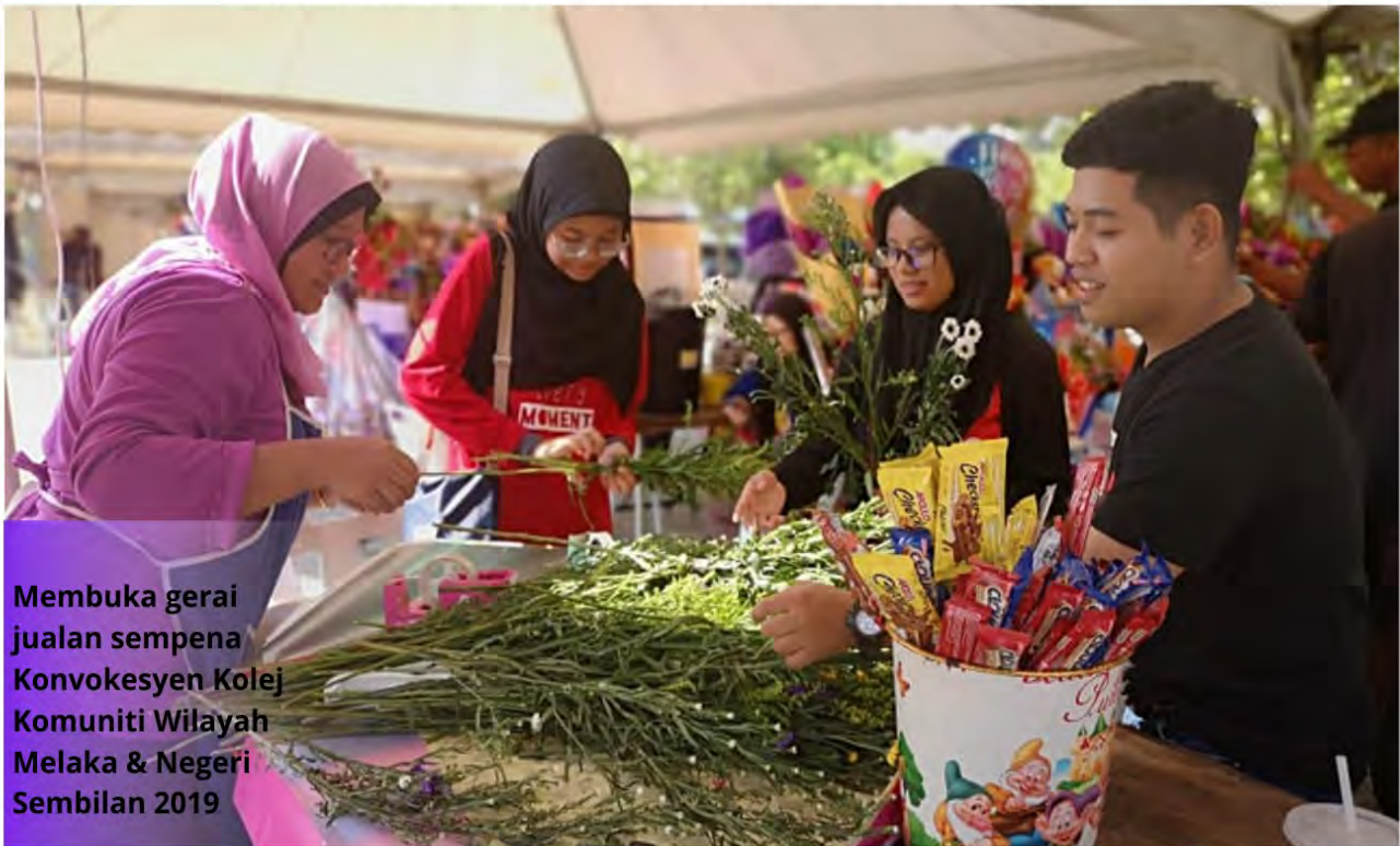
Membuka gerai jualan sempena Konvokesyen Kolej Komuniti Wilayah Melaka & Negeri Sembilan 2019