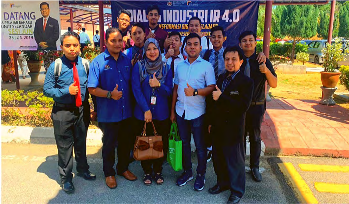
OLEH: AMIR ARIEF BIN ZAINAL ABIDIN