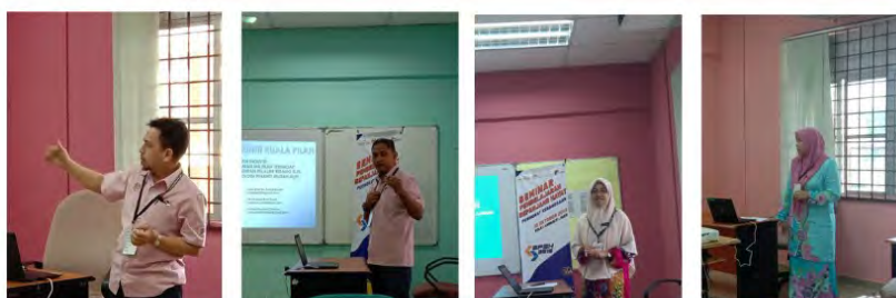
SPSH 2019 : 4 PEMBENTANGAN PENYELIDIKAN