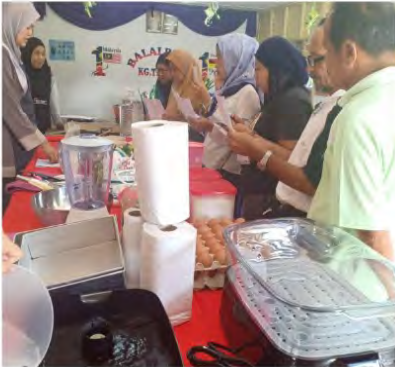
MPKK Kg Mampas Besar 26 Sept 2019 Balai Raya Kampung Besar Kursus Pembuatan Roti Komersil 40 Peserta

Bersama Majlis Pengurusan Komuniti Kampung (MPKK) Negeri Sembilan