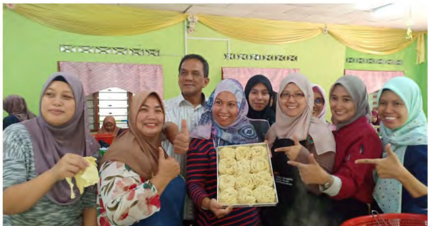
MPKK Kg Godang, Terachi 23 Okt 2019 Balairaya kg. Godang Terachi 40 peserta