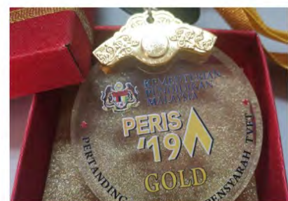
PERISA '19 : 1 EMAS