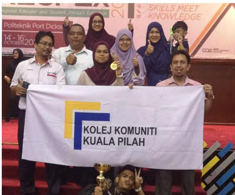
RESPEX 2019 : EMAS (BEST DIGITAL TECHNOLOGY AND PROGRAMMING PRODUCT AWARD)