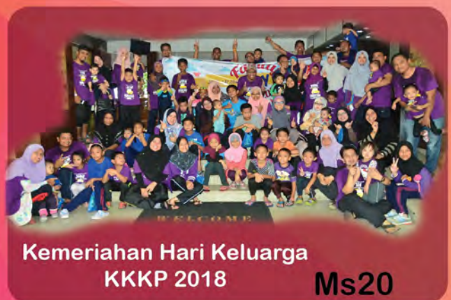
Kemeriahan Hari Keluarga KKKP 2018 Ms20