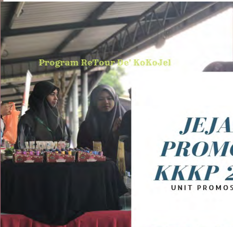
Program ReTour De' KoKoJel