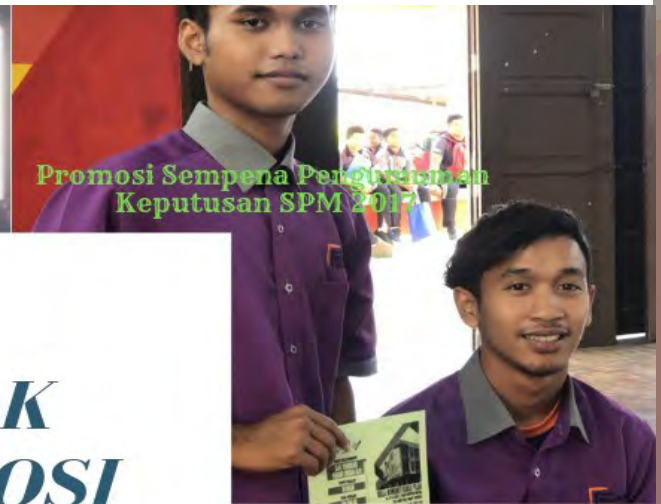
Promosi Sempena Pengumuman Keputusan SPM 2017

JEJAK PROMOSI KKKP 2018 UNIT PROMOSI KKKP