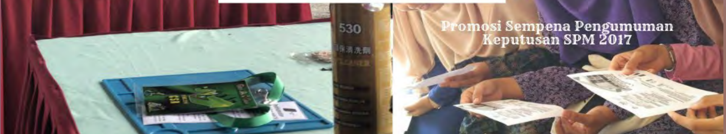
Promosi Sempena Pengumuman Keputusan SPM 2017

JEJAK PROMOSI KKKP 2018 UNIT PROMOSI KKKP