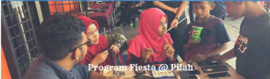
Program Fiesta @ Pilah