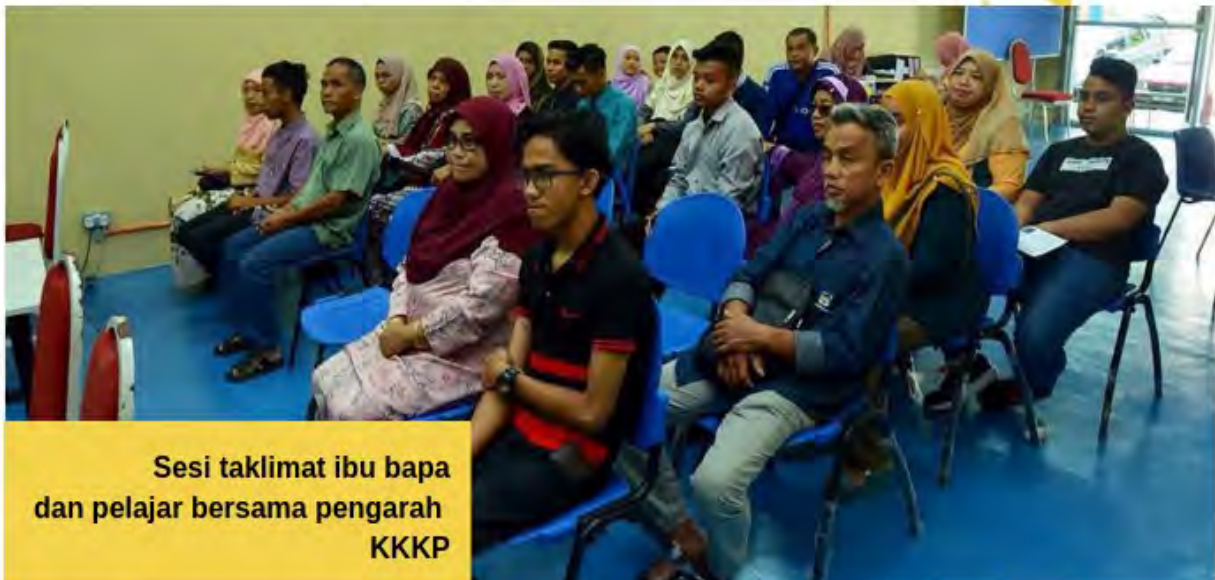
Sesi taklimat ibu bapa dan pelajar bersama pengarah KKKP