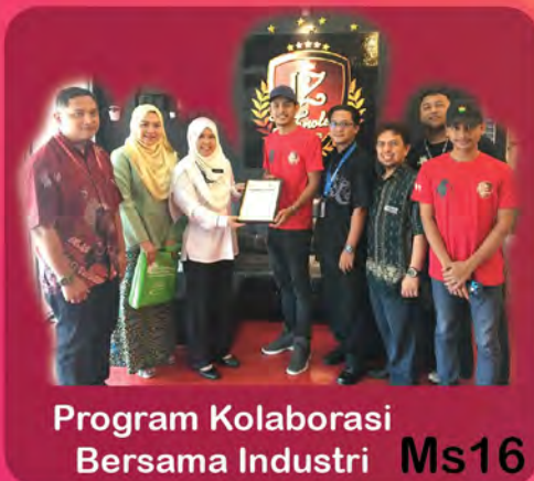
Program Kolaborasi Bersama Industri Ms16